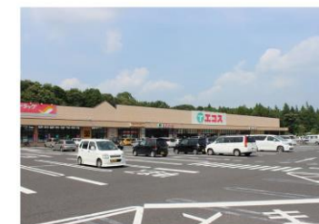
城里ショッピングプラザ